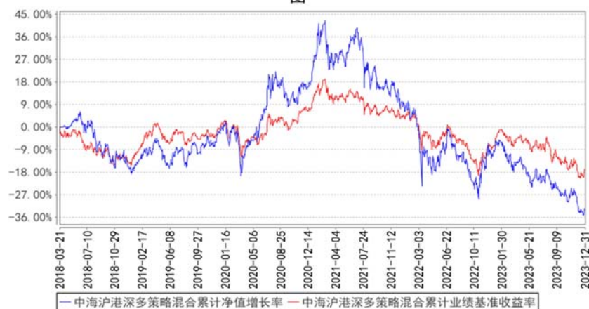
中海沪港深多策略混合累计净值增长率与同期业绩比较基准收益率的历史走势对比图